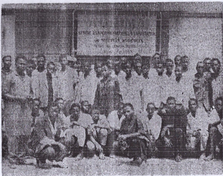
Notre photo : des élèves d'une école de conducteurs d'engins agricoles d'un centre d'expérimentation et d'exploitation de matériels agricoles.

Dans les campagnes, nos frères agriculteurs doivent stimuler la production en créant l'émulation socialiste dans les coopératives. Ils doivent également comprendre la nécessité d'entretenir dans de bonnes conditions les engins agricoles et parer à tous les aléas naturels.